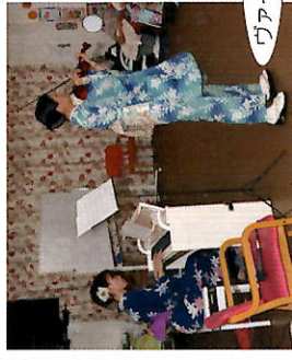
ヴァイオリンとピアノ