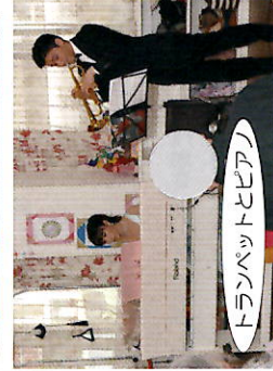
トランペットとピアノ