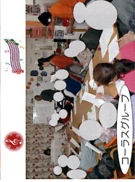
コーラスグループ