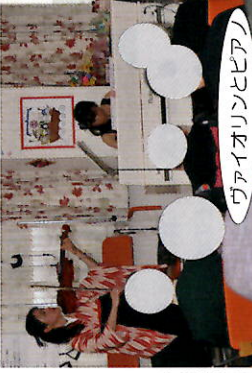
ヴァイオリンとピアノ